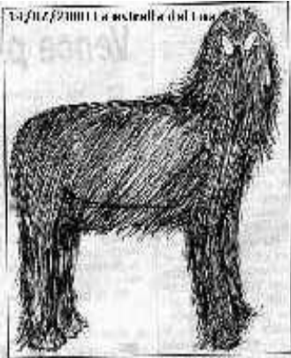
Boceto del extraño animal descrito por la profesora.